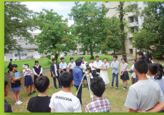
夏休み集中講座(地学実習)