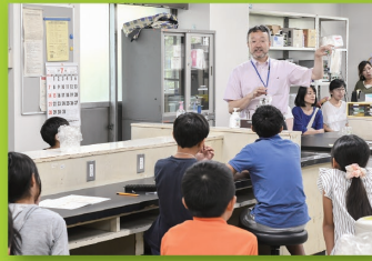
一日大学生(生物実習)