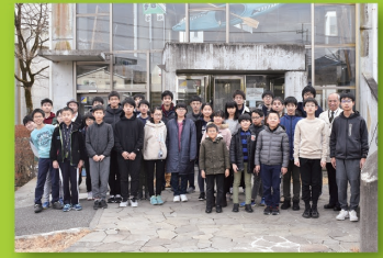
国内合宿(集合写真)