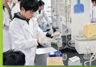
みんなで科学(化学実習)