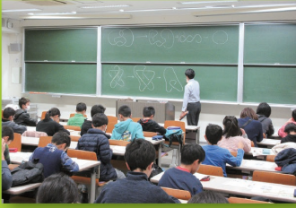
土曜ジュニアセミナー(数学講義)