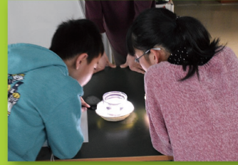
みんなで科学(物理実習)