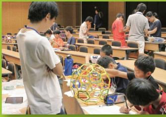
一日大学生(数学実習)