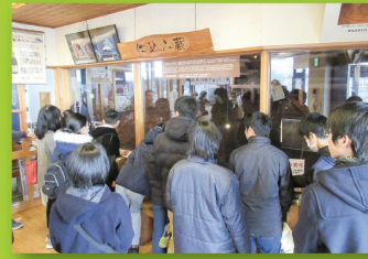
国内合宿(工場見学)