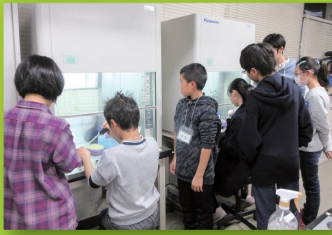
グループ研究(生物)