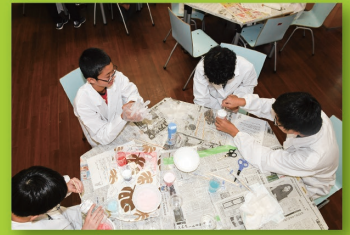
サイエンスカフェ