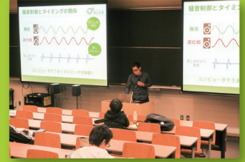
冬休み集中講座(情報講義)