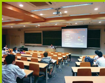
【ステップ2】 夏休み集中講座(物理)