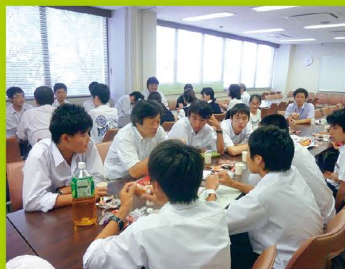
【ステップ1・2・3】 サイエンスカフェ