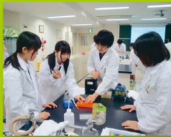
【ステップ2】 土曜ジュニアセミナー(生物)