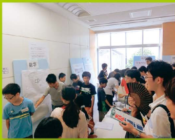
【ステップ1】 一日大学生(ポスターセッション)