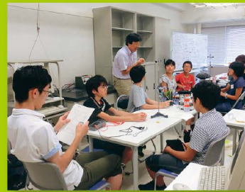
【ステップ1】 一日大学生(物理)