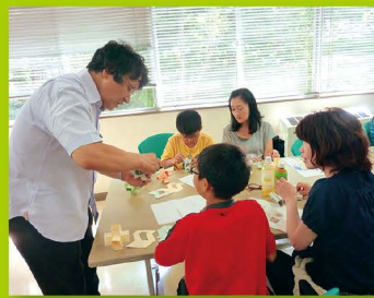
【ステップ1】 土曜ジュニアセミナー(数学)