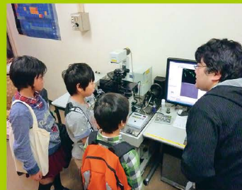
【ステップ1・2・3】 科学分析支援センター見学