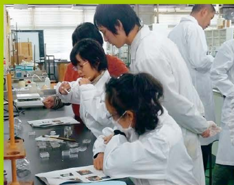
【ステップ2】 冬休み集中講座(化学)