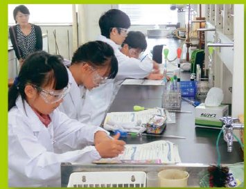
【ステップ1】 一日大学生(化学)

放射線と放射性物質について物理的に正しく理解し、その利用と危険面を解説します。その上で、自然界に存在する各種放射線を取り上げて、より身近な存在としてその性質に迫りたいと思います。