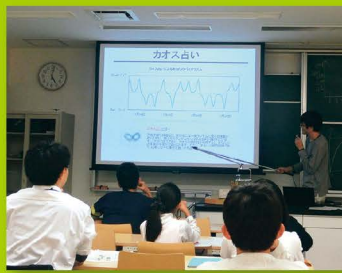
【ステップ2】 土曜ジュニアセミナー(情報)