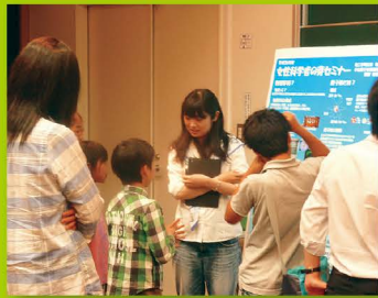
【ステップ1・2・3】 女性科学者の芽セミナー