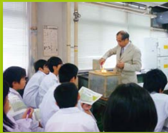
【ステップ1】 土曜ジュニアセミナー(化学)