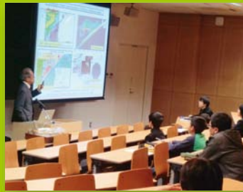
【ステップ2】 土曜ジュニアセミナー(地学)