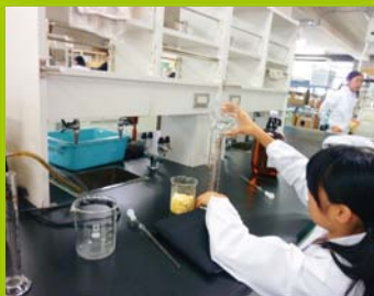
【ステップ1】 一日大学生(化学)