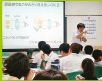
【ステップ1】 土曜ジュニアセミナー(物理)

操作できることが特長です。本講義では、色々な方式のタッチパネルの動作原理についてお話しします。さらに、未来のタッチパネルとして、柔らかいタッチパネル、様々な触感がするタッチパネル、触らないタッチパネル(?)などを紹介し、人間とコンピュータをつなぐインターフェースのあり方について考えます。