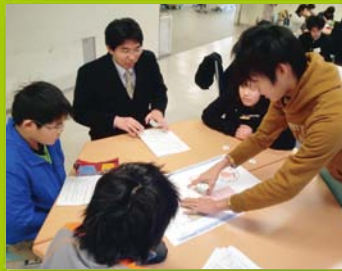
【ステップ1・2】 サイエンスカフェ