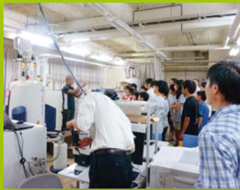
【ステップ1・2・3】 研究施設見学