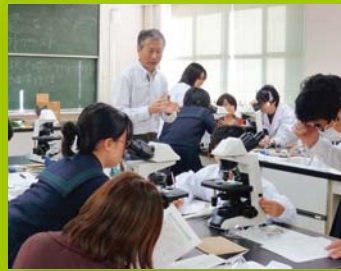
【ステップ1】 親子で科学(生物)