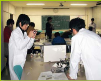
【ステップ1】 土曜ジュニアセミナー(物理)