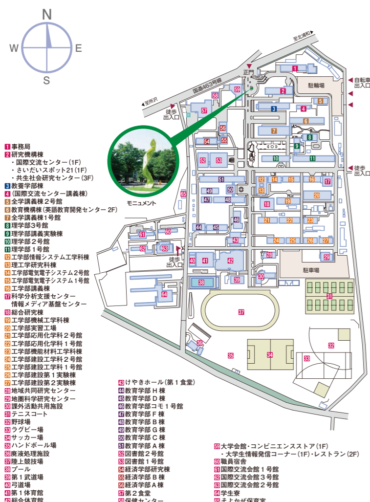
大久保キャンパス構内案内図