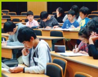
【ステップ2】 土曜ジュニアセミナー(情報)