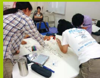
【ステップ1】 一日大学生(物理)