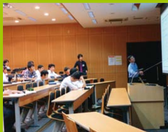
【ステップ2】 土曜ジュニアセミナー(数学)