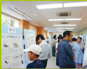
【ステップ1】 一日大学生 ポスター発表