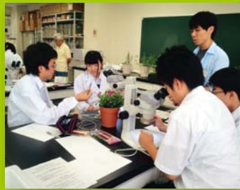
【ステップ2】 夏休み集中講座(生物)