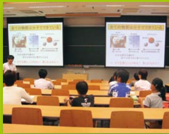
【ステップ2】 夏休み集中講座(化学)