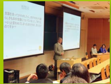
【ステップ1・2・3】 総まとめ Q&A