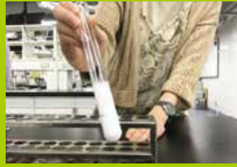
一日大学生(化学実習)