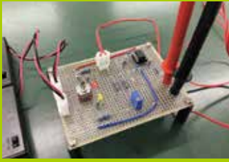
一日大学生(物理学実習)