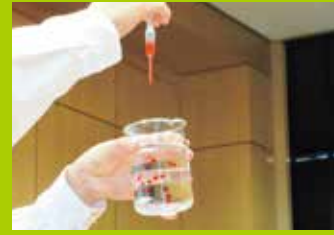
土曜ジュニアセミナー(化学講義)