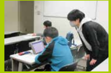
グループ研究(数学・情報班)

今年度の講座はCOVID-19の流行状況に応じて、オンラインまたは対面で実施します。 実施方法や実施場所については、改めて講座実施2週間前を目安にホームページに掲載します。