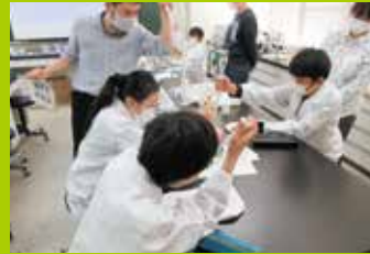
土曜ジュニアセミナー(生物学実習)