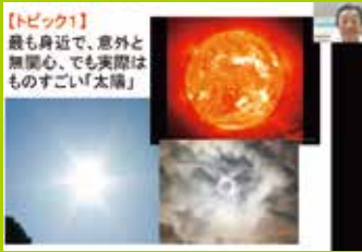
土曜ジュニアセミナー(物理学講義)