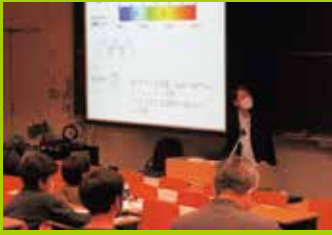
冬休み集中講座(化学講義)