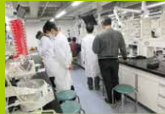
みんなで科学(化学実習)