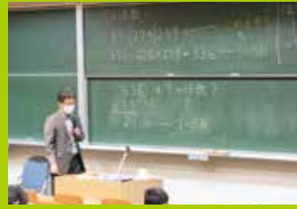
冬休み集中講座(数学講義)